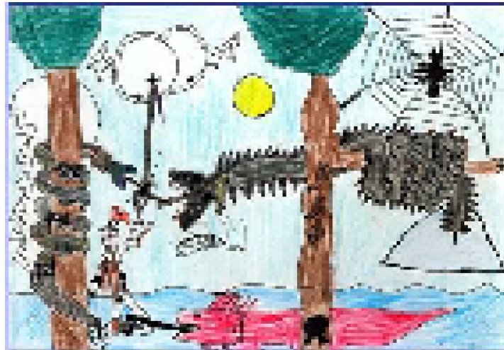
Initiateurs / initiatiefnemers

Des témoins et des experts seront entendus au sujet des faits et du contexte, éventuellement par vidéo ou par téléphone.